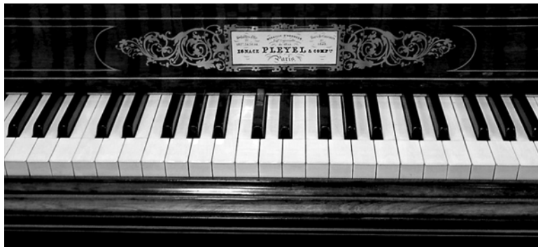
Pleyel 1858, collection Edwin Beunk